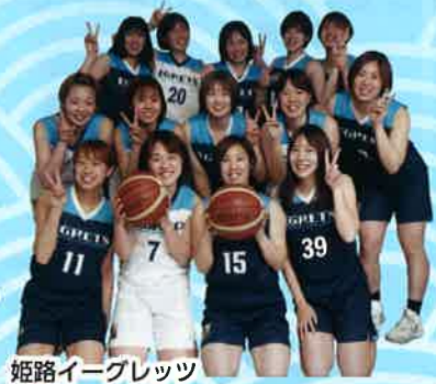
姫路イーブレッツ